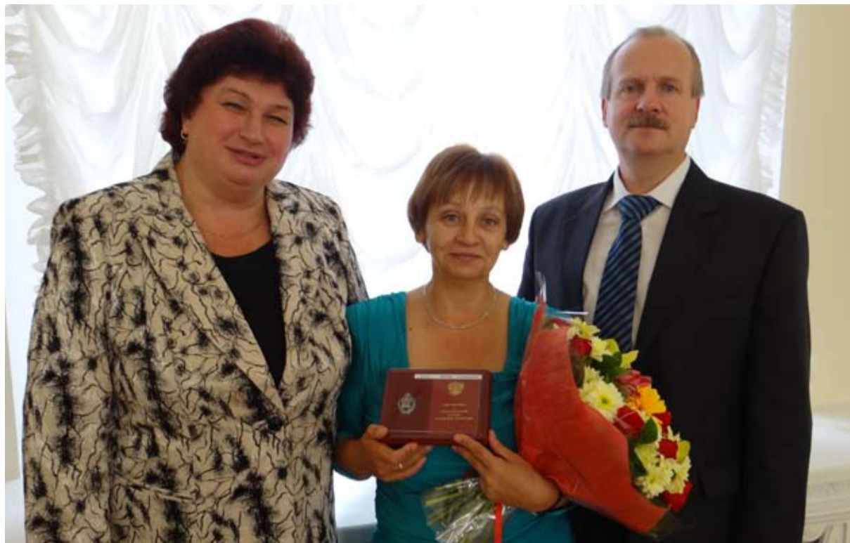
На церемонии награждения в Смольном

Штат сотрудников формировался постепенно, равно как и ремонтная база. В первое время я всё и всех одалживала (не только арматуру, запчасти, но и слесарей, слесарей КИПиА, электриков). На переговоры уходило много времени. Домой приходила только ночевать. Но со временем работа наладилась.