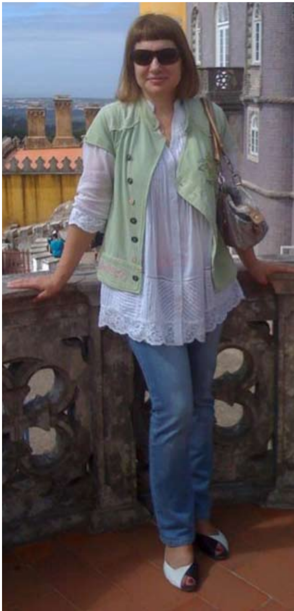
В отпуске предпочитаю свободный стиль

- Разумеется. Я полагаю, что выглядеть стильно, элегантно и женственно для дамы такая же работа, такой же труд. И его результатом является отношение окружающих. Когда женщина хорошо выглядит, она непременно получит комплимен-