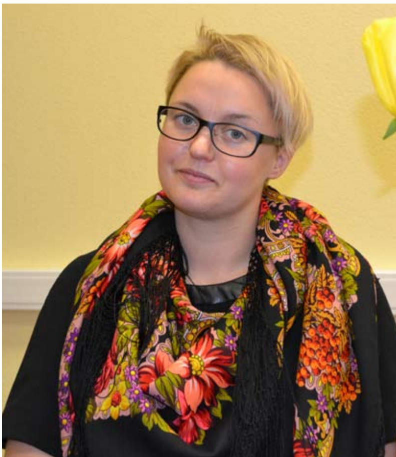
В будущее с оптимизмом

- Помимо основных критериев, таких как образование, опыт работы, я оцениваю желание человека трудиться, учиться, развиваться. Также важен некий профессиональный юридический азарт. Конечно, я не могу сказать, что все мои со-