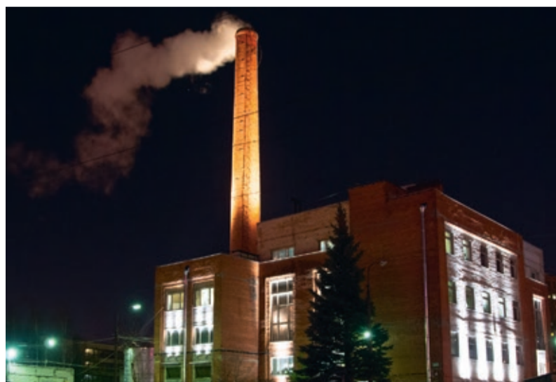
Липовая аллея, 17