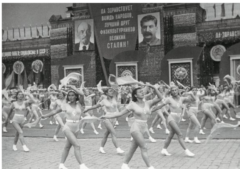
Москва. Физкультпарад. 1938.

Спартакиада — спортивные соревнования, названные в честь Спартака, возглавившего крупнейшее восстание рабов в древнем Риме. Первые спортивные соревнования состояли из самых популярных видов спорта.