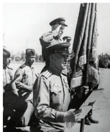
Клятва при вручении полку Гвардейского Красного Знамени