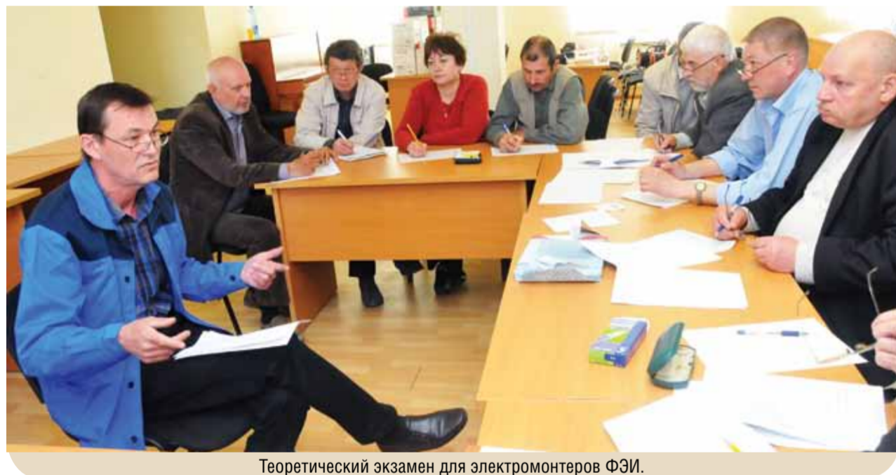
Теоретический экзамен для электромонтеров ФЭИ.