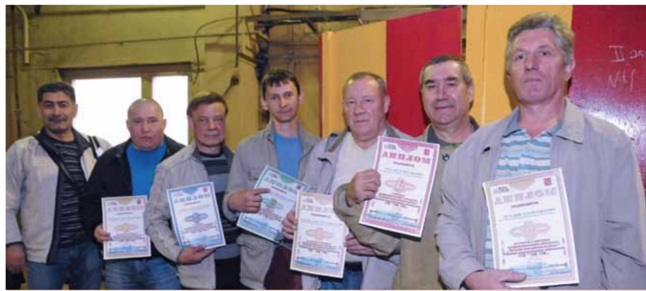
Участники конкурса электрогазосварщиков ФЭИ.