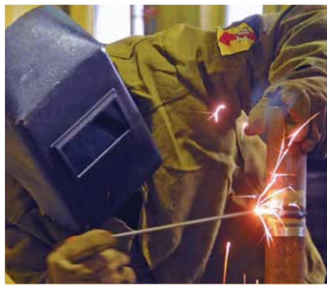
Сварить трубу нужно было быстро и качественно.