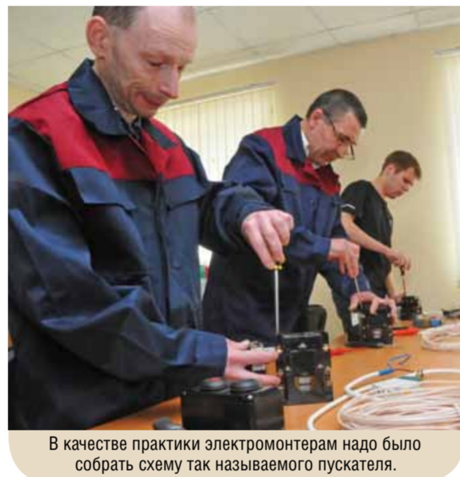
В качестве практики электромонтерам надо было собрать схему так называемого пускателя.