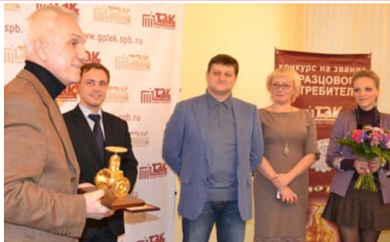
Получать «Золотой вентиль» почетно

Отметим, что в настоящее время вопрос дебиторской задолженности - один из самых острых во взаимоотношениях между ресурсоснабжающими организациями и исполнителями коммунальных услуг. Основными причинами формирования задолженности у исполнителей коммунальных услуг являются неплатежи граждан (конечных потребителей), отсутствие единого информационного пространства между