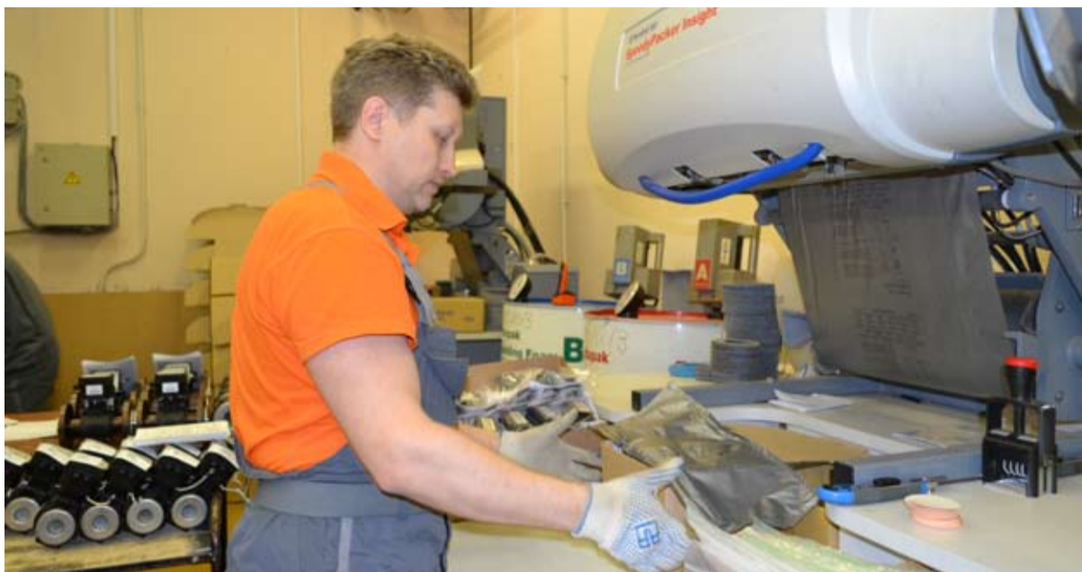
Контроль важен на всех этапах производства