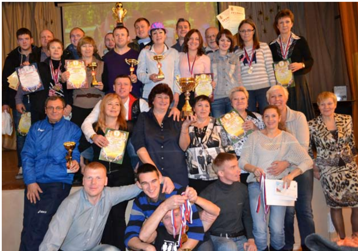
Спортивная гордость ГУП «ТЭК»

30 ноября в актовом зале базы отдыха «Уют» прошло традиционное награждение спортсменов ГУП «ТЭК СПб» по итогам комплексной спартакиады. Сотрудники предприятия, занявшие первые, вторые и третьи места в соревнованиях трудовых коллективов, были отмечены медалями, кубками, а также ценными призами и денежными премиями.